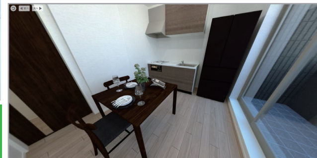
※写真は完成前の想定パースとなります。