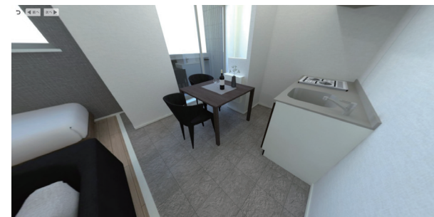
玄関からダイニング床土間仕立て