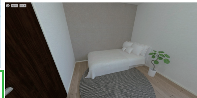
※写真は完成前の想定パースとなります。